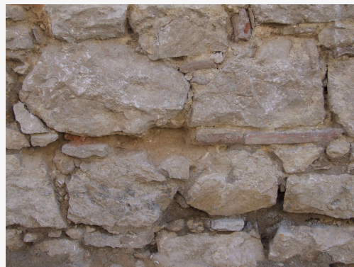
Giunti tra gli elementi di pietra da stuccare con malta di calce aerea. I giunti, prima di procedere alla risarcitura debbono essere ripuliti dalle impurità.

I solai in legno sovente possono presentarsi instabili al passaggio di una persona per insufficiente rigidità dell'assito. Quando le travi principali sono in buone condizioni, l'irrigidimento di solai in legno può essere effettuato applicando uno strato di tavole da cm 4 in senso ortogonale a quello esistente, avendo cura di rendere solidale tra loro i due assiti mediante chiodatura. Il collegamento alle murature è realizzato con piattine ancorate al solaio e bloccate con un capochiave a piastra sulle pareti della muratura esterna.