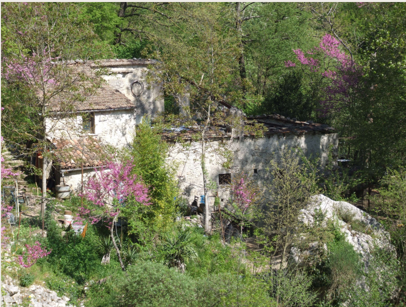
Colli al Volturno – Mulino RADDI

Il mulino Raddi di Colli al Volturno è posto al centro di un paesaggio suggestivo: la vegetazione, il fiume, la terra ed il cielo sono ancora i protagonisti assoluti, la cornice più degna di questo gioiello di architettura produttiva messa a riposo quarant'anni fa da un capriccio del fiume. Il mulino infatti smise di funzionare nel 1966 dopo 140 anni di onorato lavoro, a seguito di una forte inondazione del fiume Volturno che lo devastò, rendendolo inutilizzabile, distruggendo la copertura piana, le attrezzature, le tramogge.