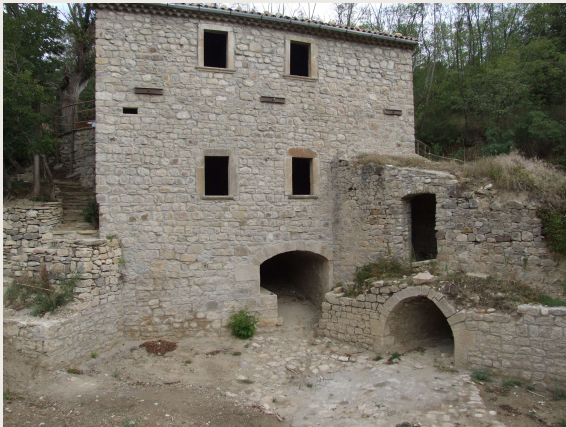
Macchia Valfortore – Mulino DI IORIO – La seconda refota. Si nota sulla destra il cunicolo di adduzione che recupera l'acqua utilizzata dal primo mulino.

Nel fondaco del primo mulino a livello della seconda refota si apre un locale con volta a botte dotato di caditoia ma priva di ruota orizzontale. Con molta probabilità, nel passato, questo vano era stato adibito ad una attività artigianale complementare al mulino: la gualchiera o valicaturò; macchina idraulica per eseguire la follatura dei tessuti.