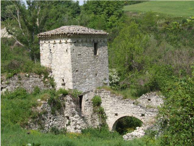
Montelongo – Mulino ad acqua.