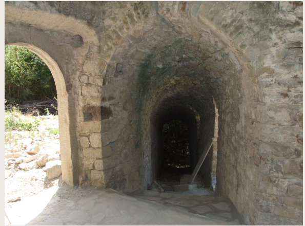
Macchia Valfortore – Mulino DI IORIO – Galleria di collegamento tra il mulino superiore e quello inferiore.

I due mulini sono resi comunicanti tra loro da una galleria coperta con volta a botte che è l'anello di congiunzione tra i due corpi di fabbrica e nel contempo l'elemento architettonico caratterizzante tutto il complesso. La galleria a gradoni disegna un percorso suggestivo unico nel suo genere e molto probabilmente serviva per il transito degli asini adibiti al trasporto dei cereali e della farina tra il mulino di sopra e quello di sotto.