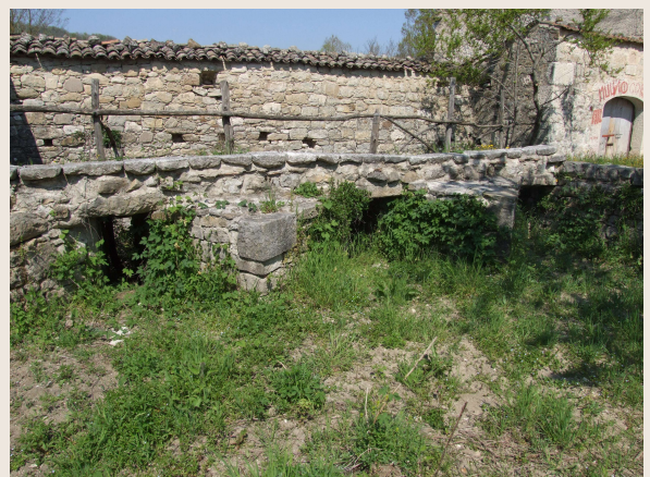
Baranello – Mulino Corona – La refota.

Nell'uno e nell'altro caso, l'acqua confluiva dentro le caditoie ("docce"): condotti in muratura o in legno che scendono fin dentro il fondaco del mulino, dove erano collocate le ruote orizzontali ("retrecine o ritrecine"). La conformazione delle docce ad imbuto rovesciato imprimeva all'acqua, durante il salto, velocità e forza necessaria a far girare la retrecina. Sulle bocche delle caditoie, dentro fori praticati nella pietra, erano sistemate delle grate di ferro per trattenere i detriti trasportati dall'acqua, i quali, impattando la retrecina, avrebbero potuto danneggiarla.