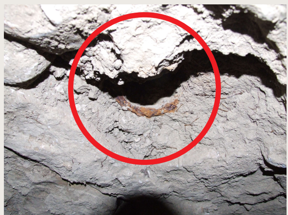
Macchia Valfortore – Mulino DI IORIO – Foro passante dell'albero rotore praticato nella volta del vano retrecina.

Il vano della retrecina è quindi il luogo fisico dove era piazzato il motore del mulino composto da un blocco rotore solidale: la ruota orizzontale, l'albero rotore e la macina mobile.