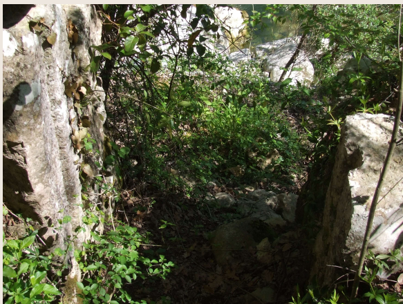
Colli al Volturno – Mulino RADDI – Stipiti della chiusa del canale di adduzione dell'acqua. Sono ancora visibili le scanalature nella pietra entro cui scorreva il portellone in legno di quercia.

Le dimensioni del canale erano assai variabili e dipendevano dalle dimensioni del mulino e dalla portata del fiume; se la portata del fiume era abbondante, il canale alimentava direttamente i rotori del mulino senza opere aggiuntive (come nel caso del mulino "Raddi" a Colli al Volturno); dove, viceversa, il carico del fiume o del vallone era limitato, il canale, in prossimità del mulino, si allargava fino a formare una vasca di accumulo ("refota"), la quale, una volta riempita, doveva contenere una quantità di acqua sufficiente a far girare il mulino (come nel caso del mulino "Di Iorio" di Macchia Valfortore). Alternando cicli di riempimento della refota a cicli di macinatura, il mulino poteva quindi funzionare anche quando il vallone aveva poca acqua.