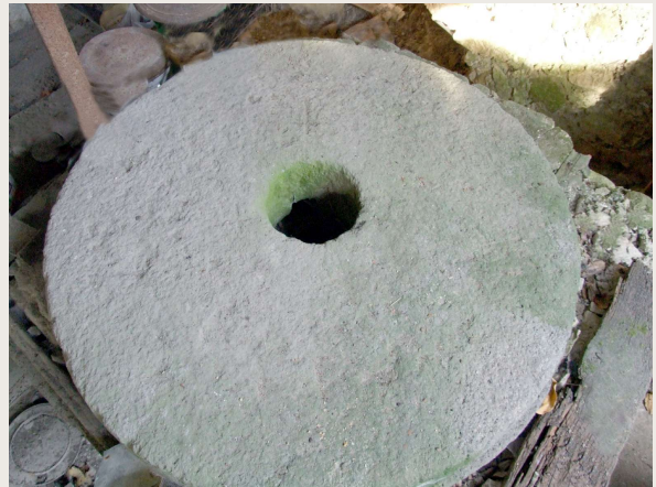
Colli al Volturno – Mulino RADDI – Occhio della macina.

Le macine erano segnate sulla superficie di contatto da una quindicina di scanalature a raggiera, dei solchi sulla pietra simili a raggi di bicicletta.