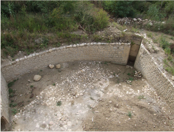
Macchia Valfortore – Mulino DI IORIO – La refota, sullo sfondo l'imboccatura della caditoia ("docce").