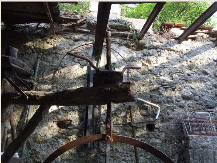
Colli al Voltorno – Mulino RADDI – Verricello utilizzato per spostare la macina dalla sede di lavoro.

Una volta eseguita la riparazione della macina il mugnaio, con l'operazione inversa, la ricollocava nella sua sede di lavoro e procedeva, prima di riavviare il mulino, al bilanciamento della stessa.