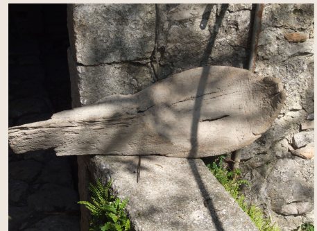
Colli al Voltorno – Mulino RADDI Particolare di una pala a cucchiaio.

La naticchia aveva una duplice funzione; la prima, quella di rendere solidale la macina mobile al fuso e, quindi, di rendere possibile con la sua rotazione la molitura del cereale; la seconda, quella di bilanciare la macina mobile, agendo con degli spessori di carta simili a quelle da gioco per avere nel suo moto rotatorio sempre lo stesso spessore rispetto alla macina fissa.