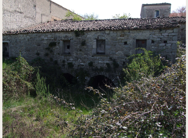
Baranello – Mulino Corona.