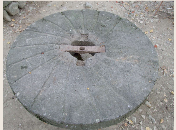
Colli al Voltorno – Mulino RADDI – Particolare del bilanciere “ naticchia ” inserito nella parte inferiore della macina mobile.

Il fuso, al di sopra della retrecina, dopo aver attraversato il foro della volta a botte e quello della macina fissa, terminava con un’asta metallica quadrangolare dove veniva inserito il bilanciere (“ naticchia ”). La naticchia era una farfalla di ferro con due ali che, una volta agganciata all’asta metallica quadrangolare del fuso, si andava ad inserire dentro una sede scavata nella parte inferiore della macina mobile.