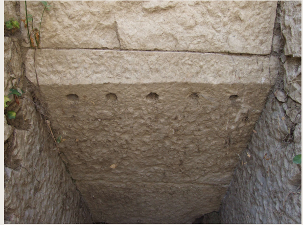
Macchia Valfortore – Mulino DI IORIO – Particolare della bocca della caditoia. Nei fori scavati nella pietra venivano sistemate le grate per impedire l'accesso di detriti trasportati dall'acqua.

Nel fondaco del mulino, nel punto più basso, troviamo il vano della retrecina. Il numero di questi vani varia a seconda della grandezza del mulino: ci sono tanti vani retrecina per quante erano le macine. Il vano retrecina è solitamente di una ventina di metri quadrati, alto quanto basta per permettere comodamente il passaggio di un uomo in piedi; nella volta a botte ci sono almeno tre fori che comunicano col vano sovrastante dove erano piazzate le macine: in uno di questi fori passava l'albero del sistema rotore; dagli altri due passavano la catena e la vite che consentivano al mugnaio, dalla stanza delle macine, alcune manovre che vedremo nel dettaglio più avanti.