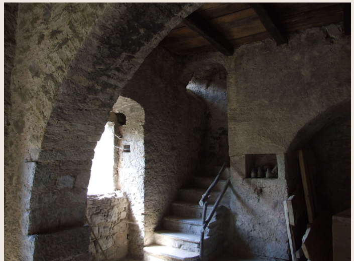
Macchia Valfortore – Mulino DI IORIO – Interno.

Il mulino posto alla quota superiore veniva approvvigionato dell'acqua di una prima refota che metteva in funzione la macina per il frumento o il granone ad uso umano. L'acqua così utilizzata non veniva riversata nel vallone ma incanalata e raccolta, per mezzo di cunicoli in muratura, in una seconda refota per far girare il mulino situato alla quota più bassa, riservato alla molitura delle granaglie per uso zootecnico.