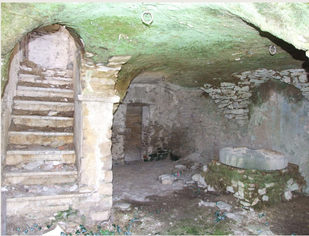
Pettoranello del Molise – Particolare delle macine.

Le macine quindi erano due: la prima (quella inferiore) era fissa, aveva una superficie leggermente convessa; la seconda (quella superiore), come abbiamo visto, era mobile, aveva una superficie leggermente concava.