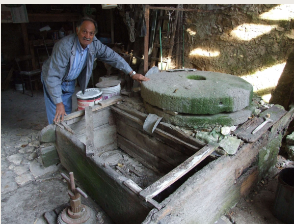
Colli al Volturno – Mulino RADDI - Il farinaio

Il farinaio era una grossa cassa in legno di quercia posta davanti alla macina per raccogliere la farina e poteva contenere oltre due quintali di prodotto. Per riempire il farinaio ci volevano almeno un paio d'ore di molitura. Conseguentemente per macinare un quintale di farina il mulino doveva girare per circa un'ora. La farina, dal farinaio, veniva riversata dal mugnaio dentro i sacchi con l'aiuto di una pala di legno. I sacchi utilizzati per contenere la farina potevano essere sia di canapa che di lino; rispetto ai sacchi normali questi avevano una trama più stretta in modo da non lasciare uscire la farina durante la fase di stoccaggio e di trasporto del prezioso carico.