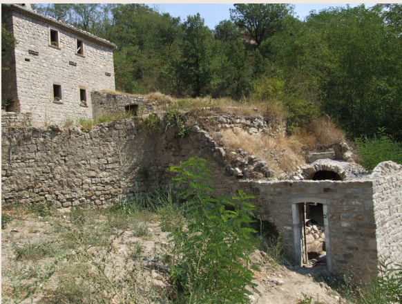
Macchia Valfortore – Mulino DI IORIO – Profilo longitudinale del mulino. Sono in evidenza i volumi dei due mulini.

Il complesso di Macchia Valfortore è un'architettura composta da due mulini posti a quote differenti per sfruttare la stessa acqua: un esempio di razionalizzazione della forza motrice non sempre disponibile in questi luoghi in tutti i periodi dell'anno.