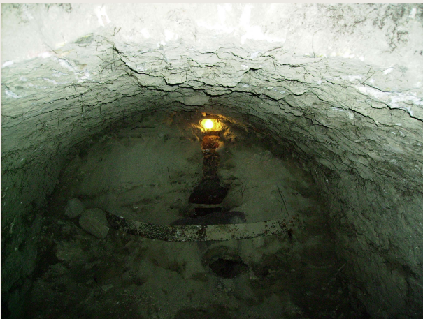
Macchia Valfortore – Mulino DI IORIO – Vano della retrecina. La ruota sta per essere ripulita dai detriti accumulati nel tempo.

Nel fondaco del mulino, nel punto più basso, troviamo il vano della retrecina. Il numero di questi vani varia a seconda della grandezza del mulino: ci sono tanti vani retrecina per quante erano le macine. Il vano retrecina è solitamente di una ventina di metri quadrati, alto quanto basta per permettere comodamente il passaggio di un uomo in piedi; nella volta a botte ci sono almeno tre fori che comunicano col vano sovrastante dove erano piazzate le macine: in uno di questi fori passava l'albero del sistema rotore; dagli altri due passavano la catena e la vite che consentivano al mugnaio, dalla stanza delle macine, alcune manovre che vedremo nel dettaglio più avanti.