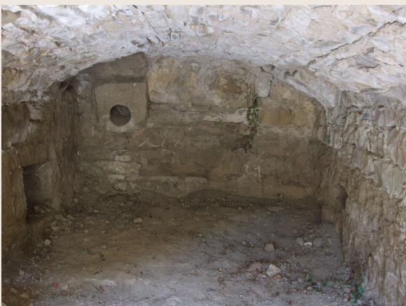
Macchia Valfortore – Mulino DI IORIO – Interno della probabile guaiachiera.

Il mulino posto alla quota superiore veniva approvvigionato dell'acqua di una prima refota che metteva in funzione la macina per il frumento o il granone ad uso umano. L'acqua così utilizzata non veniva riversata nel vallone ma incanalata e raccolta, per mezzo di cunicoli in muratura, in una seconda refota per far girare il mulino situato alla quota più bassa, riservato alla molitura delle granaglie per uso zootecnico.