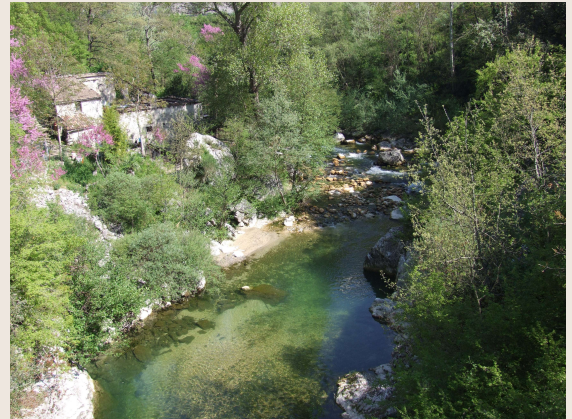
Colli al Volturno – Mulino RADDI

I mulini ad acqua erano dei manufatti a carattere produttivo che sfruttavano la forza motrice dell'acqua per muovere l'apparato molitorio necessario a macinare la farina. L'elemento fondamentale del sistema mulino era dunque l'acqua. Essa veniva deviata dal fiume, incanalata, accumulata, utilizzata e restituita al suo percorso naturale al termine del ciclo lavorativo. L'invio dell'acqua al mulino avveniva attraverso un canale costruito dal proprietario con lavori di sbarramento sul fiume attuati con grossi massi o gabbionate. L'ingresso era regolato da una chiusa ("portellone") in legno di quercia, che si alzava ed abbassava dentro guide di dura pietra azionata a mano da un addetto tramite un manubrio a vite. Lungo il canale erano presenti altri portelloni che servivano, all'occorrenza, a svuotare il condotto nel caso si dovesse effettuare la pulizia o la normale manutenzione del mulino.